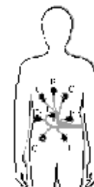
SensorArray aplicado no abdómen